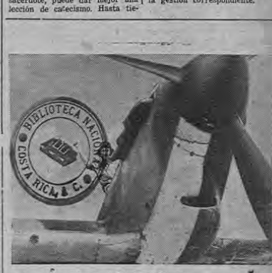
A las brillantes victorias de las tropas británicas contra los italianos en el Desierto Occidental, deben añadirse las de las Fuerzas Aéreas. Aquí vemos un piloto de un "Hurricane" de combate, de los que han derribado muchos aeroplanos italianos en las batallas aéreas de ese desierto.

Como en este curso lectivo trabajarán varios sacerdotes como maestros de religión, en colegios y escuelas, ha surgido una dificultad, en cuanto al sueldo que les corresponda. Por no tener título se les considera como aspirantes y su dotación resulta muy baja. Se considera que esto es una anomalía, ya que nadie, como el sacerdote, puede dar mejor una lección de catecismo. Hasta tiene la práctica, ya que el párroco atiende la enseñanza catequística. Además, hay un decreto de una administración pasada, en que se estudió este caso, considerando al sacerdote, cuando imparte lecciones de catecismo, como maestro de primera categoría. Con éste antecedente se hará la gestión correspondiente.