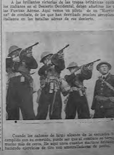
Cuando los cañones de largo alcance de la escuadra Británica cumplen con su cometido, puede ser que el combate se termine mucho más de cerca. He aquí unos cuantos marineros Británicos haciendo ejercicio de tiro con ametralladoras de popa.